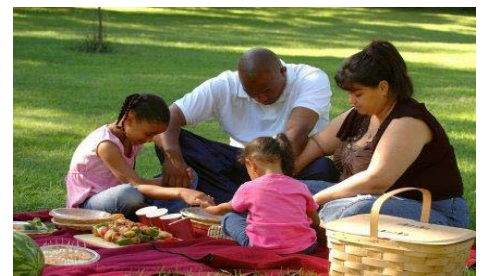
“...la FAMILIA que ORA junta PERMANECE junta.”

les. Recuérdeles la diferencia entre las situaciones seguras e inseguras. Usted recibirá una carta que le dará valiosa información para hablar con sus hijos sobre las situaciones inseguras.